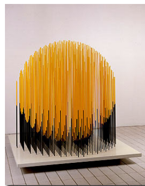
Arriba izquierda: Obra de Vasarely