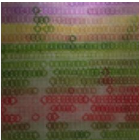
SILENCIO EN LA MÚSICA, 2014 ÓLEO SOBRE LIENZO 50 X 50 CM

Sus obras están en un rango entre $300 a $12,000 y pueden verse en Galería Impakto.