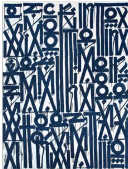
ESCORT ME TO DEATH, 2012 ACRÍLICO SOBRE LIENZO 214 x 152 CM

El artista norteamericano conocido como Retna (Marquis Lewis) inicia desde muy joven su carrera en el mundo del graffiti, los que hoy plasma en sus conocidas obras en lienzos. Estas se asemejan a una caligrafía de múltiples idiomas o culturas; dice ser influenciado por el inglés antiguo, árabe, hebreo y las mitologías nativas americanas. Este vocabulario único transmite para Retna una forma de poesía universal y es que al ver sus obras, uno siente que puede "leer" un texto. Por la continuidad de su obra, Retna está considerado como muy importante dentro de la abstracción moderna. Los precios de Retna fluctúan actualmente entre los $18,000 - $40,000 dependiendo del tamaño de la obra y los precios en subasta siempre superan los precios bases de las mismas.