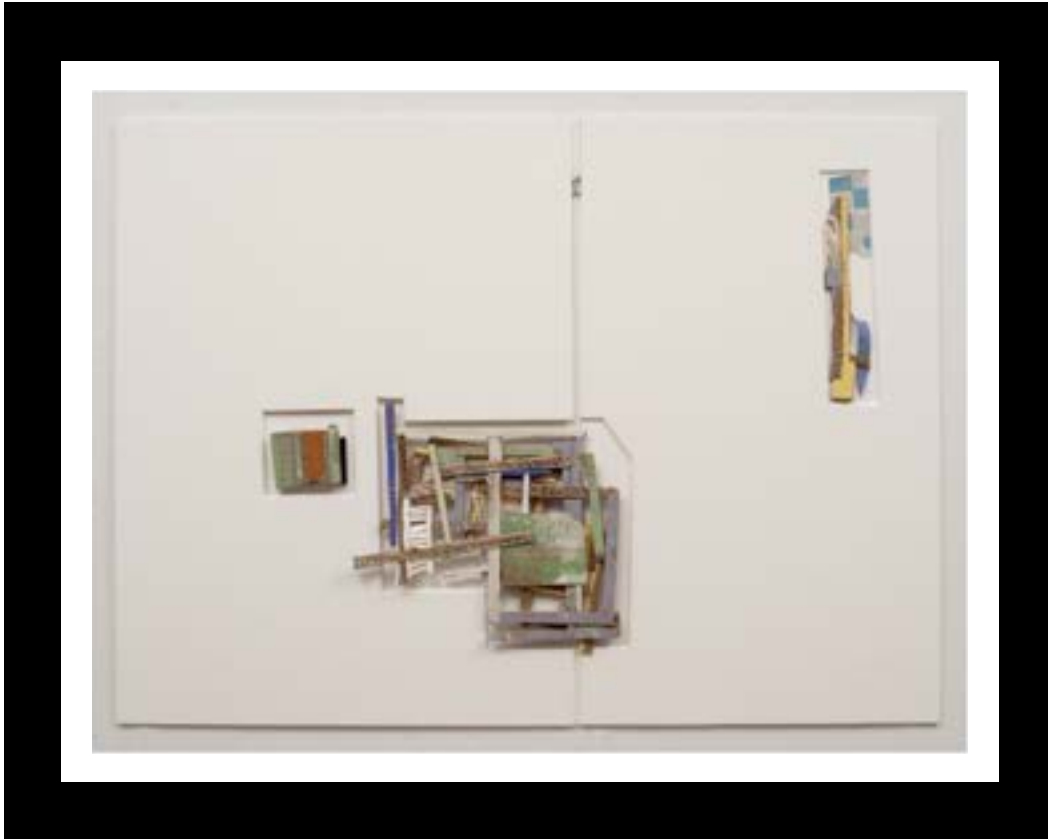
FOTOGRAFÍA ANA TISCORNIA. SERIE “DESHABITACIONES” FOTO CORTESÍA GALERÍA DEL PASEO

PRIMERA EDICIÓN - NOVIEMBRE / DICIEMBRE 2015