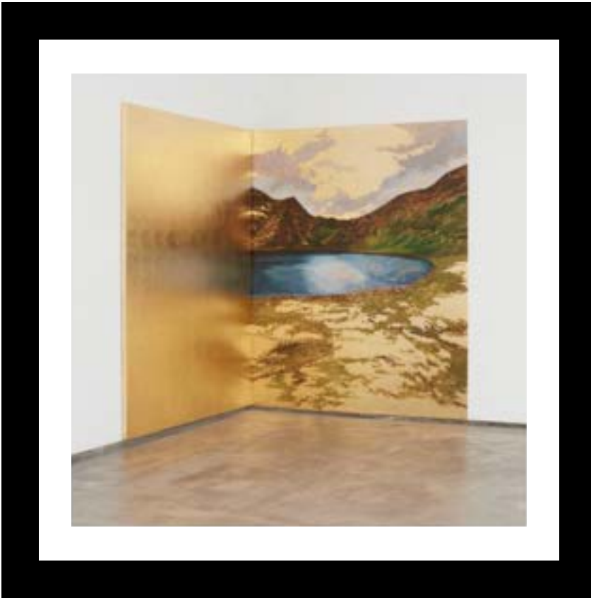
Sandra Gamarra Sin Título. 2015.

Falso pan de oro sobre tela y falso pan de oro y óleo sobre pared. 201 x 162 cm. Serie de 3