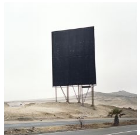
ANUNCIO DE INVIERNO, 2014 IMPRESIÓN A PARTIR DE NEGATIVO FORMATO MEDIO

Las obras de la fotógrafa Maricel Delgado tienen siempre una historia que contar. Delgado estudió fotografía en Gaudi (hoy Centro de la Imagen). Ha realizado varias residencias para artista y ha expuesto de forma individual y colectiva en distintos países del mundo. Su trabajo reciente se centra en proyectos que miran el opuesto al éxito y al progreso, metas que supuestamente deben ser alcanzadas en la vida pero que, lo llevan a uno a ninguna parte. Delgado cree que estos momentos en los que quizás "algo fallo" llevan al ser humano a replantearse sus expectativas y abren un terreno para nuevas experiencias. Una manera de observar y enseñar a través de su obra, la distancia entre lo ideal y la experiencia vivida. Los rangos de sus obras van de $1,000 a $3,000.