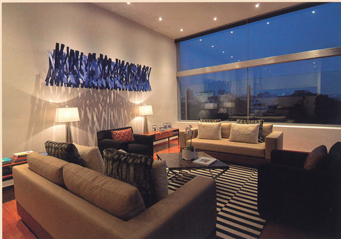
Escultura azul de Ricardo Cardenas, artista colombiano representado por galería del infinito (Argentina)

¿Cuál es tu relación con el mercado internacional? ¿Tu asesoría se concentra en Perú o has ido extendiendo las fronteras?