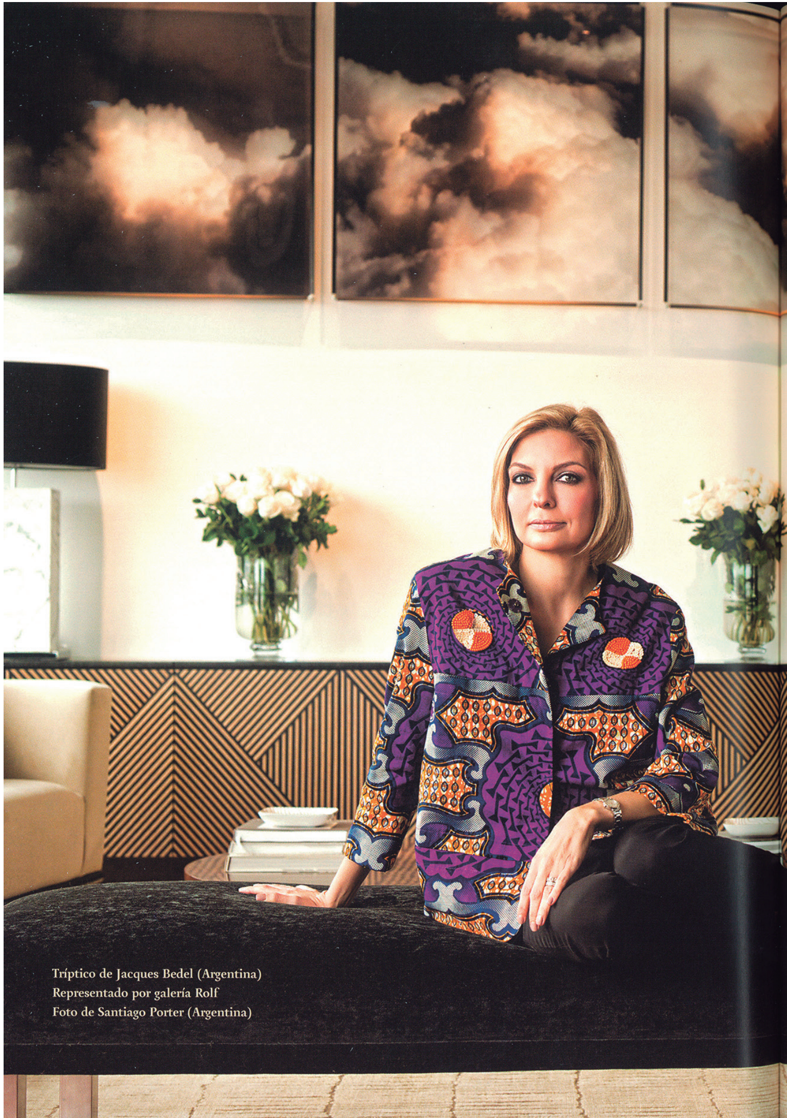
Tríptico de Jacques Bedel (Argentina) Representado por galería Rolf