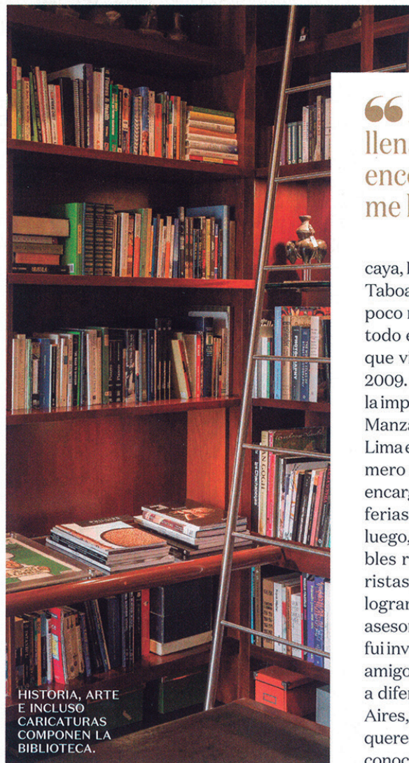
HISTORIA, ARTE E INCLUSO CARICATURAS COMPONEN LA BIBLIOTECA.

“No compro solo por llenar la pared, necesito encontrar una obra que me llene y me mueva”