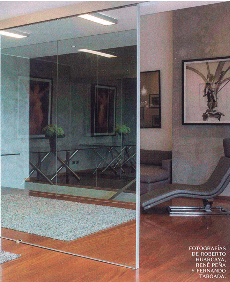
FOTOGRAFÍAS DE ROBERTO HUARCAYA, RENÉ PEÑA Y FERNANDO TABOADA.