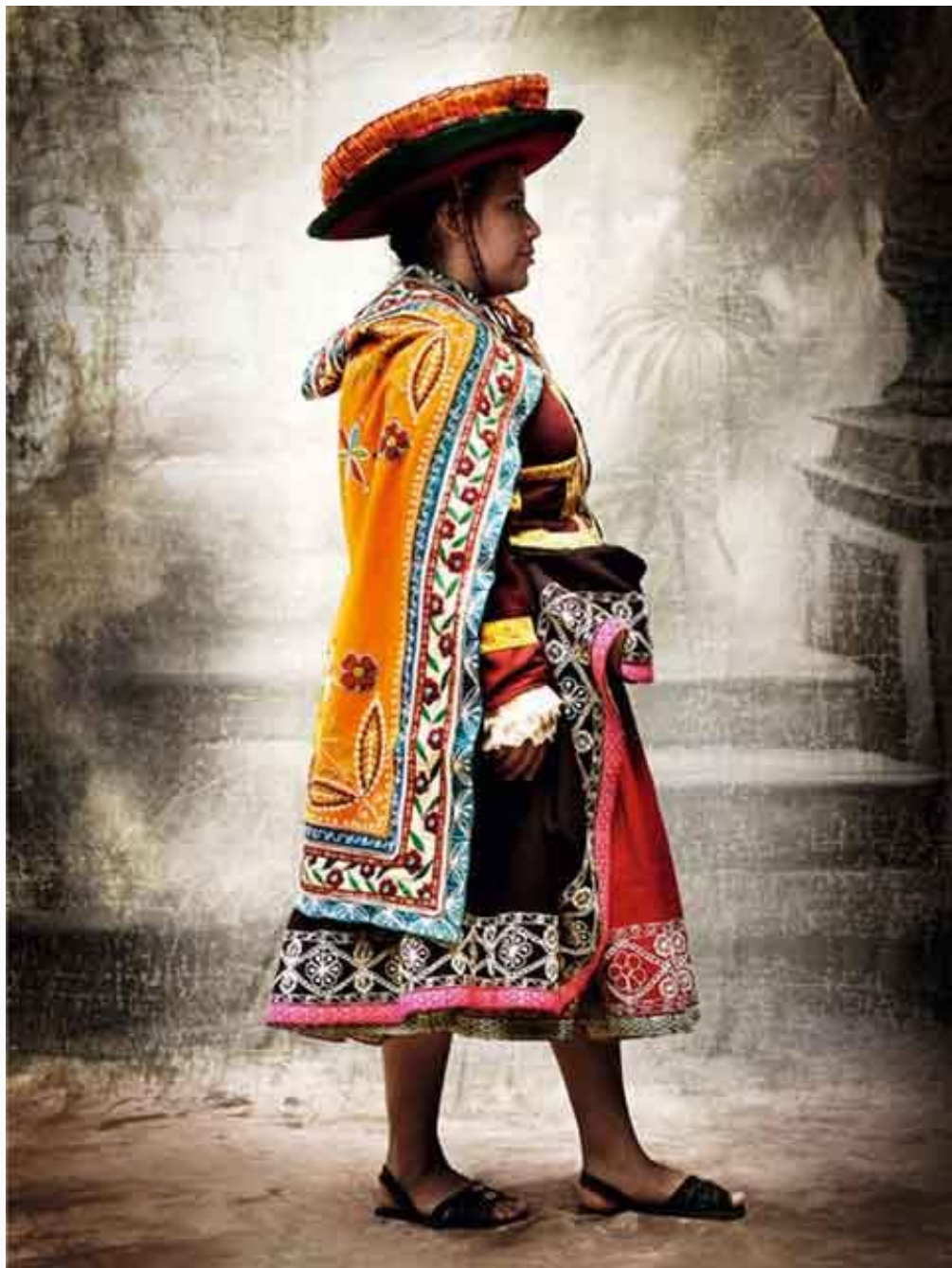
“Alta moda”, de Mario Testino.

Misión Huascarán . Asimismo, se consiguió trazar las cuatro líneas de acción de esta iniciativa, las cuales abarcan salud –a través de campañas médicas e implementación de postas–, educación –con la implementación de bibliotecas lúdicas y biohuertos escolares–, infraestructura –proponiendo mejoras en las viviendas– y producción –con el programa de cultivos agrícolas demostrativos, taller textil y de carpintería–. Este año, además, durante la cena de gala se anunciarán las nuevas alianzas estratégicas establecidas con entidades privadas, gracias a las cuales Misión Huascarán podrá redoblar esfuerzos en favor de quienes más lo necesitan.